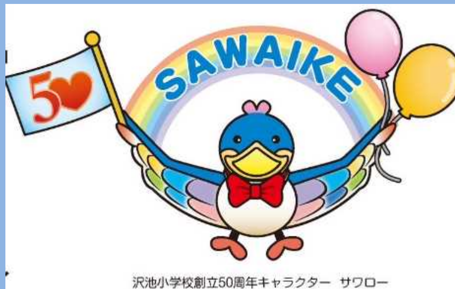
沢池小学校創立50周年キャラクター サワロー