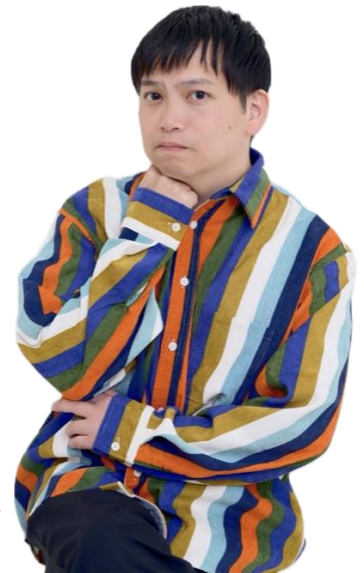
舞台演出家 こわっぱちゃん

読書は、新しい知識を得るだけでなく、いろいろな世界を旅することができ、心を豊かにしてくれます。物語を通して想像力や考える力が育ち、登場人物の気持ちを考えることで思いやりや共感力も育ちます。2月は「ふれあい月間（いじめ防止強化月間）」ですので、より一層の読書活動の充実に努めてまいります。今後は、学校評価の児童アンケート「本を読むことが好き」に肯定的な回答をする児童90%以上を成果指標にいたします。