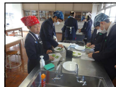
←家庭科調理実習より 【きゅうりをうまく切れたかな?】