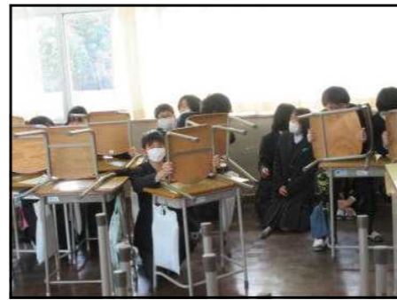
【バリケードを築いて不審者から身を守る訓練】

1月8日4校時は、1年生対象で、防災学習を行いました。これまでに、地震や火災を想定した避難訓練を行ってききましたが、今回は不審者対応を想定した避難訓練をかねて学習を行いました。教室に机や椅子でバリケードを作って、不審者から身を守る疑似体験や映像資料を基に、様々な災害を想定して避難について考える学習を行いました。避難時には、中学生として何が出来るかを考える機会となりました。災害はいつ起こるか分かりません。学校外で起こることも考える、いざというとき、落ち着いて行動できるよう準備しておきたいと思います。