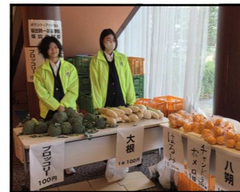
【商品販売体験しました】