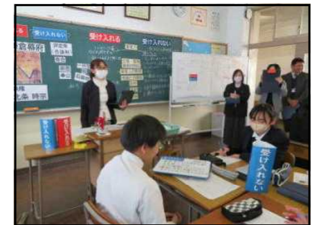
【鎌倉時代の勉強をしました】