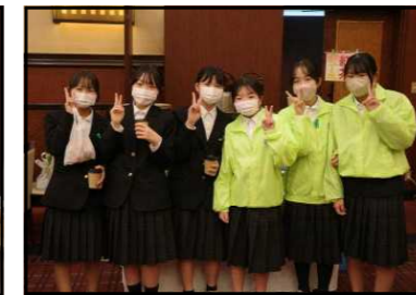
【1年生は10名が参加しました】