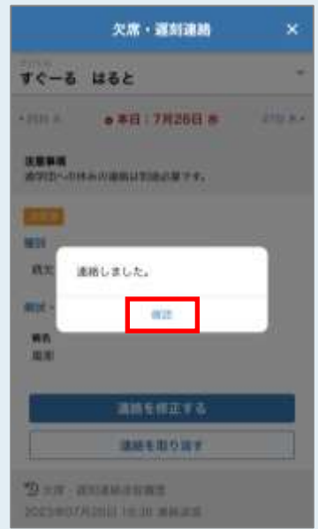
欠席連絡 送信確認