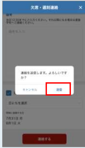
欠席連絡 送信確認