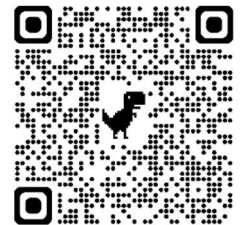
茨木市地震防災マップ

そして、夏休みのあいだの8月8日には、九州付近の日向灘を震源とする地震が発生し、そこから1週間、「南海トラフ地震臨時情報（巨大地震注意）」という政府の「特別な注意の呼びかけ」がありました。今後数十年のうちに起こるとされている南海トラフ地震は、茨木市発行の「地震ゆれやすさマップ」において、最大震度6弱が想定されています。2018年に発生した大阪北部地震では、同程度の震度で大きな被害があり、大きな地震の恐ろしさを身をもって知ることとなりました。この臨時情報は解除されましたが、大地震への備えは、今後も進めていく必要があります。学校においては、定期的な避難訓練だけでなく、普段から「お（さない）は（しらない）し（やべらない）も（どらない）」を避難の約束としています。この夏休みは、ご家庭でも、防災について見直す機会があったのではないのでしょうか。大切な命を守るために、ぜひ、避難や地震への備えについて、お話ししてください。