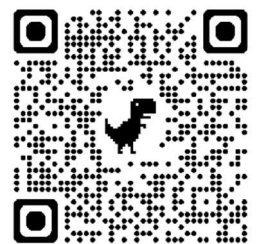
三島小非常変災対応について

さらに、今年は、台風の上陸が例年より早く、夏休みに上陸することがありました。明日には、関西地方にも台風が上陸するとの予報もあります。休校等の連絡は、まなびポケットやミマモルメでもお知らせしますが、普段より、非常変災時の対応についてホームページ等でご確認をお願いします。