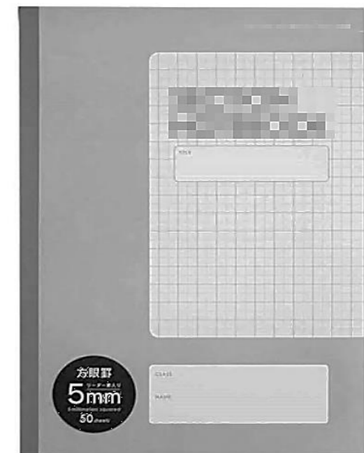
シンプルなノート例